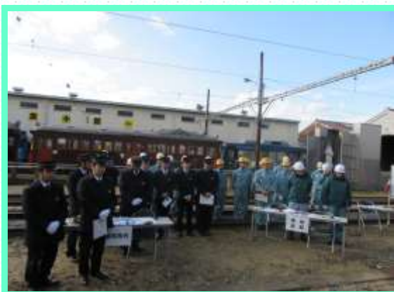
● 総合事故復旧訓練(各部門)の様子