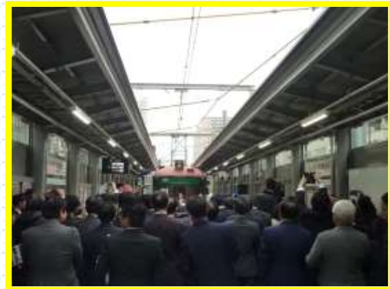
● 軌道芝生化・切替完成式典の様子