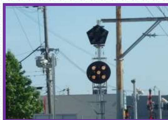
● 新設した運転士異常時列車停止装置