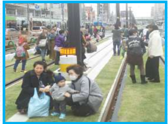
● 軌道緑化内覧会の様子