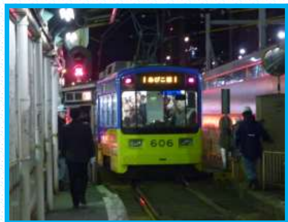
● 旧天王寺駅前停留場から最終電車の出発