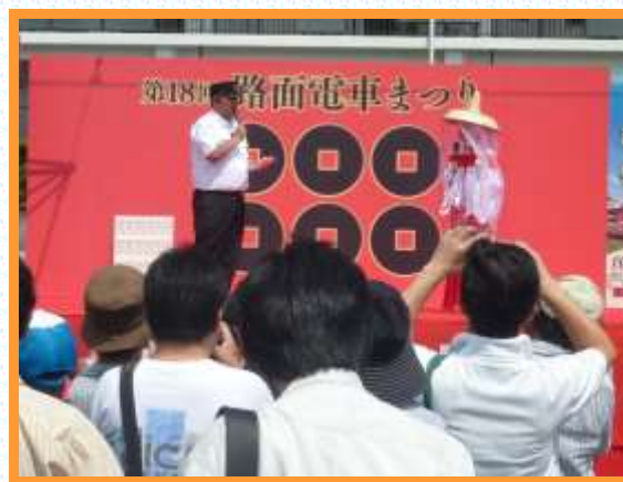
● 第18回 路面電車まつりの様子