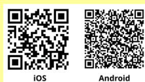
ダウンロード用QRコード

App StoreはApple Inc.のサービスマークです。Android、Google Playは、Google Inc.の商標です。iOS商標は、米国Ciscoのライセンスに基づき使用されています。