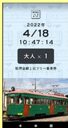
チケット画面イメージ

【購入方法】お手持ちのスマートフォンでRYDE社が運営するアプリ「RYDE PASS」からすぐにご購入いただけます。